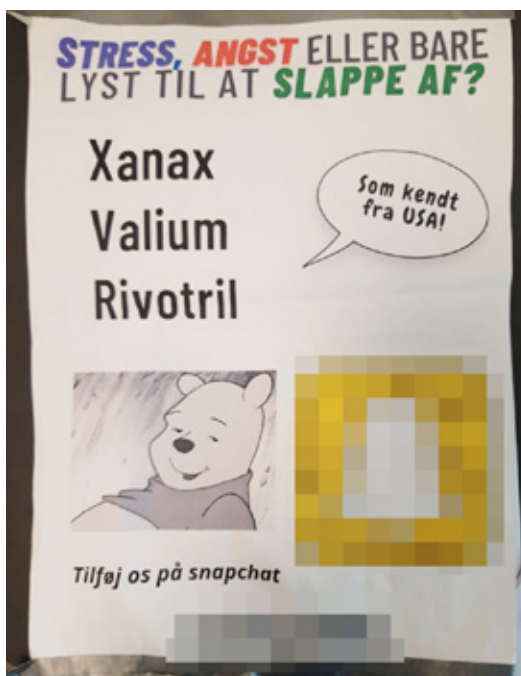
Reklame for salg af illegal medicin fundet ophængt på ungdomsuddannelsessted